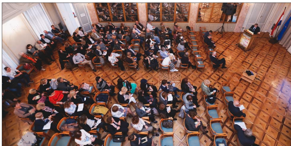
SLIKA 13. SIMPOZIJ HVD-A 2019. GODINE